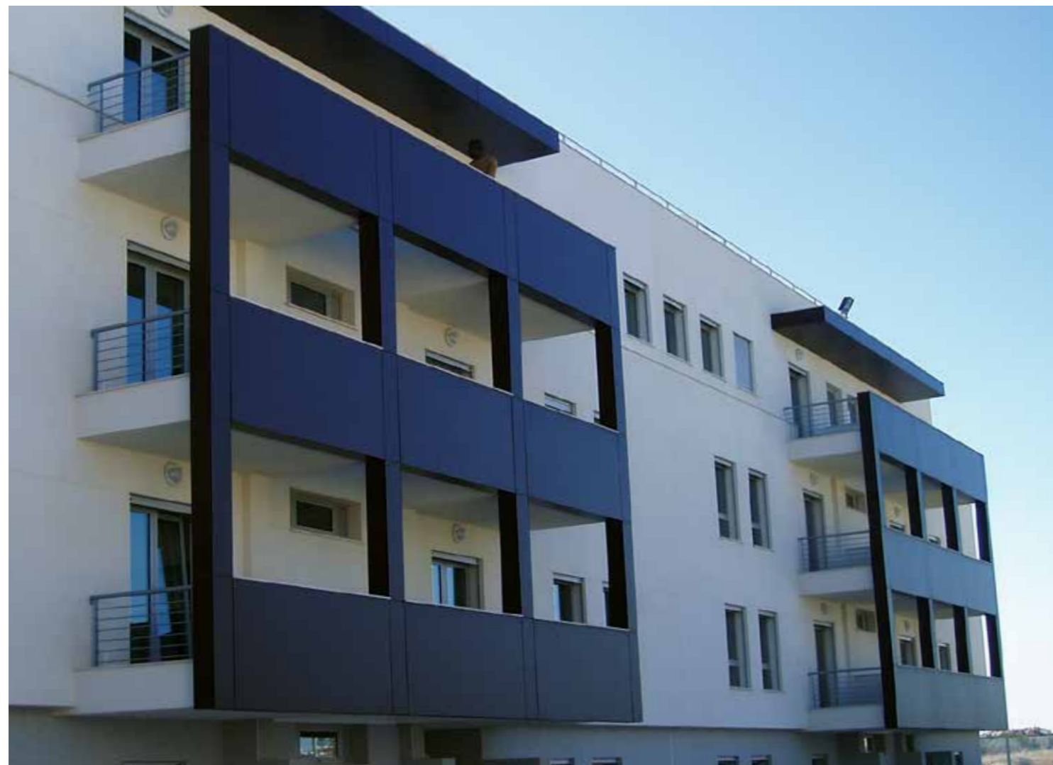
Logements | Lisbonne | Portugal

Les panneaux Trespa® Meteon® contiennent jusqu'à 70 % de fibres naturelles. Dans certains pays, l'ensemble de la gamme de produits Trespa® Meteon® est désormais disponible avec les certifications PEFC™ ou FSC™ sur simple demande, sous réserve de stocks suffisants.