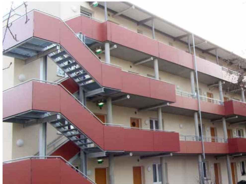
Logements | Murcie | Espagne

Trespa® Meteon® résiste aux chocs et à l'usure quotidienne.