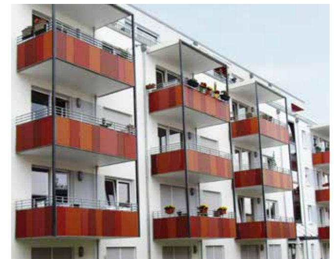
Logements | Heidelberg | Allemagne

« Au-delà de leurs qualités esthétiques, les panneaux Trespa® Meteon® sont durablement performants en extérieur. Parce qu'il conserve son aspect initial pendant de longues années, Trespa® Meteon® contribue à la réalisation de balcons à la fois beaux et résistants. »