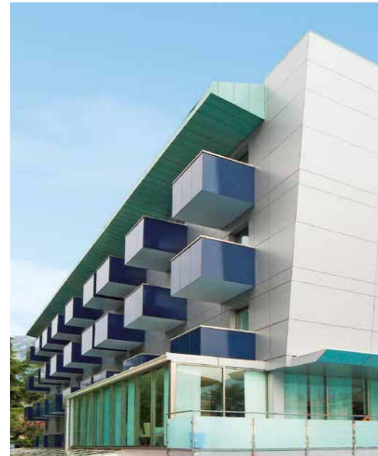
Hôtel Caravel | Torbole | Italie