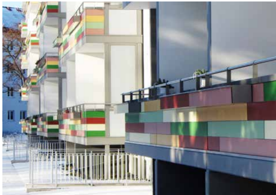
Logements | Dresde | Allemagne

Tous les produits Trespa® sont testés dans des conditions extrêmes. Les panneaux sont notamment soumis à des essais simulant les conditions d'ensoleillement, de pluie et d'humidité observées en Floride. Trespa offre une garantie de 10 ans sur son produit. N'hésitez pas à contacter votre interlocuteur Trespa local pour tout complément d'information.