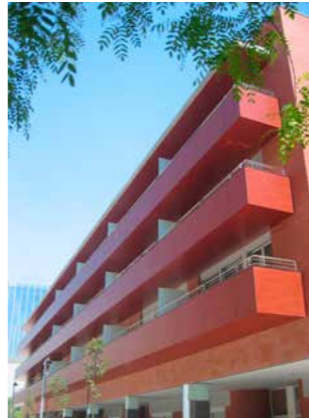
Logements | Barcelone | Espagne

En tant que spécialiste des revêtements extérieurs, Trespa peut vous aider à prendre les bonnes décisions.