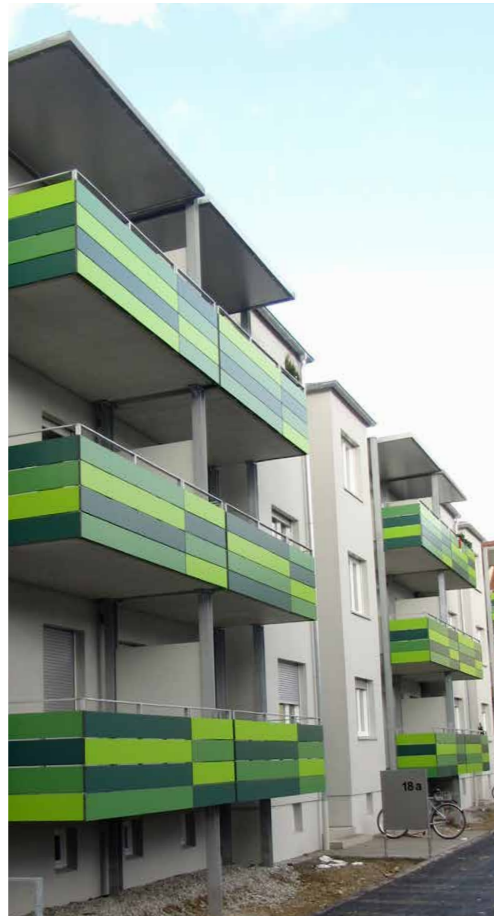
Logements | Augsburg | Allemagne

« Au-delà de leurs qualités esthétiques, les panneaux Trespa® Meteon® sont durablement performants en extérieur. Parce qu'il conserve son aspect initial pendant de longues années, Trespa® Meteon® contribue à la réalisation de balcons à la fois beaux et résistants. »