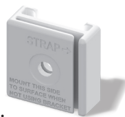
Clip 402106-20 Jeder Karton SignBOX 3 wird mit 40 Clips geliefert